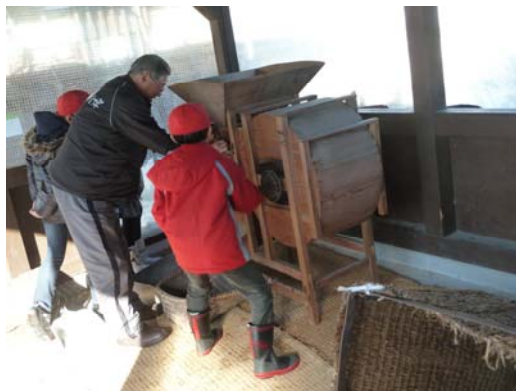
【農具体験—脱穀機、唐箕】