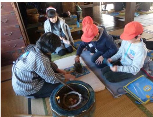
【炭火アイロン体験】