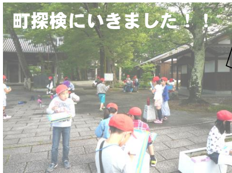
町探検にいきました！