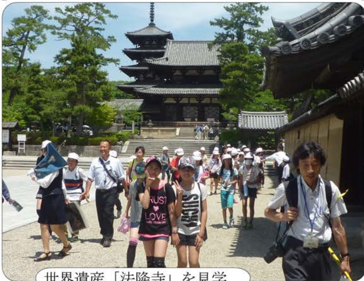
世界遺産「法隆寺」を見学

5月21・22日、5年生は町内4小学校、山東小学校と一緒にびわ湖フローティングスクールに参加しました。三井寺ウォークラリー