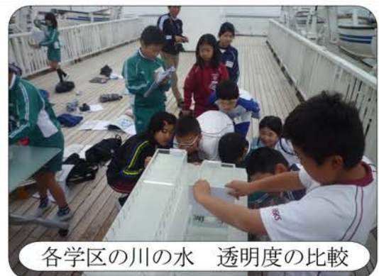
各学区の川の水 透明度の比較