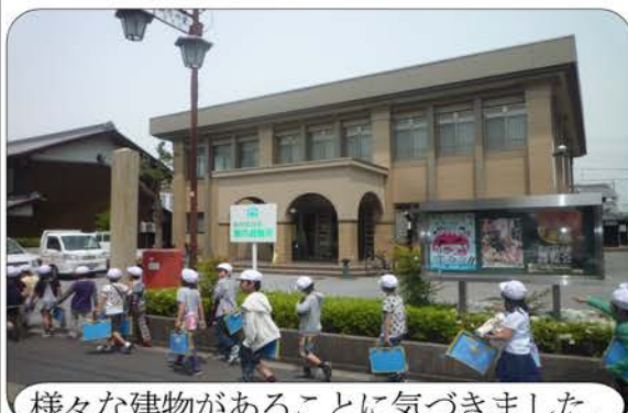
様々な建物があることに気づきました。